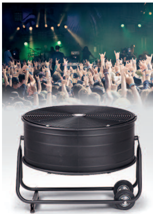
De TTV12000 in zwart, om onopvallend op podia en tijdens evenementen in te zetten.

Bij alle ventilatoren uit de TTW-serie is de uitblaasrichting verticaal instelbaar. Ook is de luchtverplaatsing in twee of drie (TTW12000) standen in te stellen.