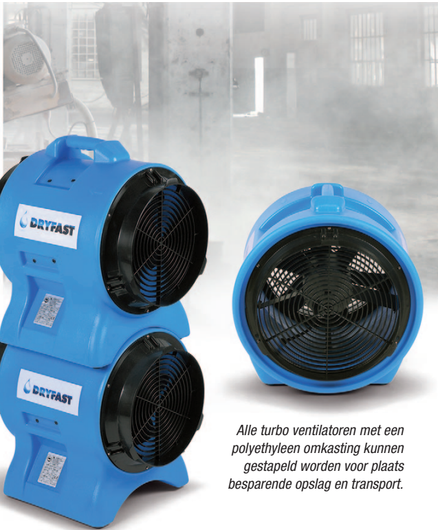
Alle turbo ventilatoren met een polyethyleen omkasting kunnen gestapeld worden voor plaats besparende opslag en transport.