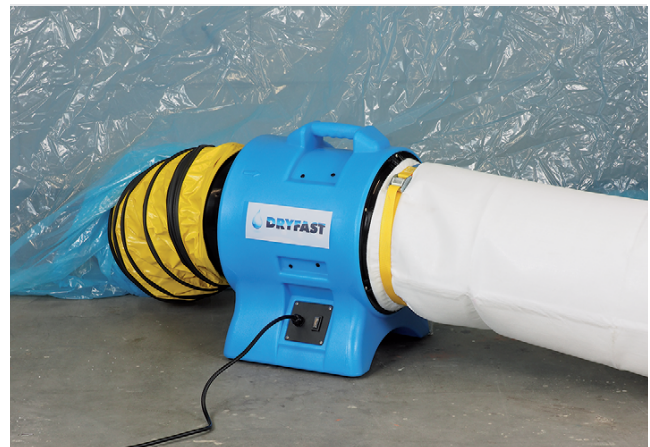
Stofbeheersing in de bouw met de Dryfast stofzakken

Kijk voor meer informatie op www.dryfast.nl / www.dryfast.be of laat u informeren door onze binnendienst of buitendienst adviseurs.